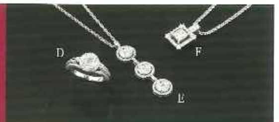
D : WG ダイヤモンド指輪 1.34ct ¥330,000 E : WG ダイヤモンドペンダントネックレス (WG チェーン付) 1.50ct ¥430,000 F : Pt ダイヤモンドペンダント (WG チェーン付) 中石 1.065ct 外 0.50ct ¥880,000