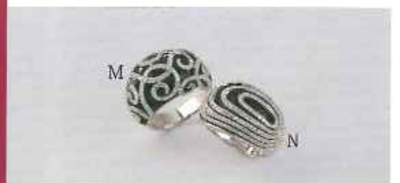
M : WG ダイヤモンドオニキス指輪 D1.31ct ¥388,000 N : WG ダイヤモンドオニキス指輪 D1.62ct ¥430,000