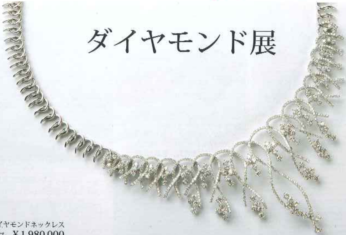
WG ダイヤモンドネックレス D7.36ct ¥1,980,000