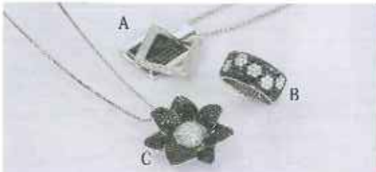
A : WG ブラックダイヤモンドペンダントネックレス (WG チェーン付) D1.50ct ¥250,000 B : WG ブラックダイヤモンド指輪 D1.34ct 0.53ct ¥298,000 C : WG ブラックダイヤモンドペンダントネックレス (WG チェーン付) D1.15ct 0.35ct ¥330,000