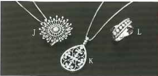
J : WG ダイヤモンドペンダント兼ブローチ 中石 0.339ct 外周 0.82ct ¥235,000 K : WG ダイヤモンドペンダント 0.78ct ¥158,000 L : Pt ダイヤモンド指輪 0.72ct ¥298,000